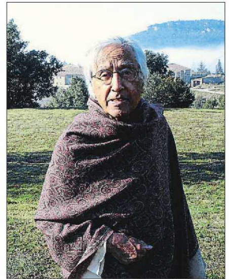
MARIA DEL MAR PALOMO / GENERALITAT

escriptor i traductor Carles Fages de Climent (Figueres, 1902-1968), amb l'objectiu de situar la seva figura i la seva obra en el canó literari català del segle XX. El comissari és Jordi Canet. La Institució de les Lletres Catalanes aporta entre 35.000 i 40.000 euros; Figueres, 20.000; i Castelló, 30.000 més.